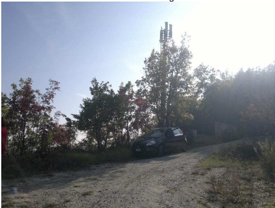
Vista area dove andrà la SRB